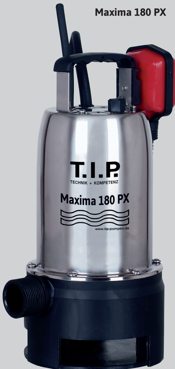
Maxima 180 PX