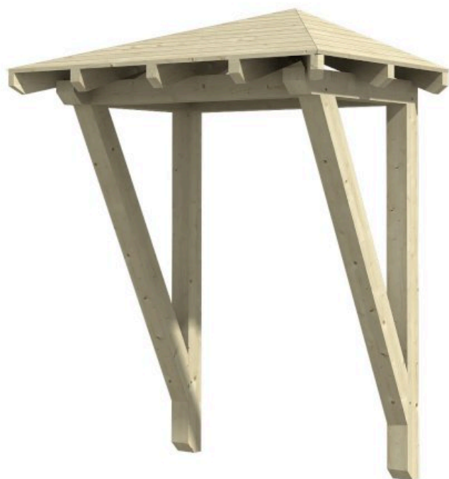
VORDACH WESEL 2 188 x 126 cm

Massive Konstruktion aus Konstruktionsvollholz (KVH-Fichte)