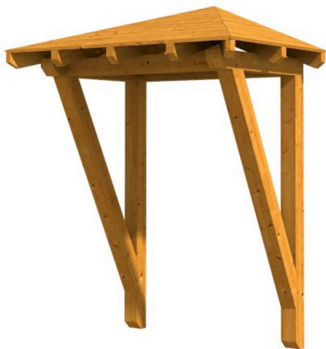
VORDACH WESEL 2 188 x 126 cm

Massive Konstruktion aus Konstruktionsvollholz (KVH-Fichte)