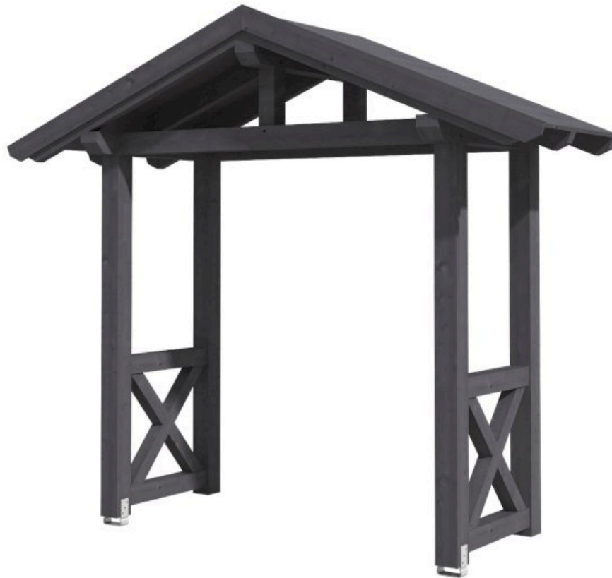
VORDACH STRALSUND 4 289 x 116 cm

Massive Konstruktion aus Konstruktionsvollholz (KVH-Fichte)