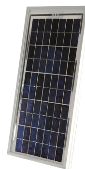
Abb. SM 10