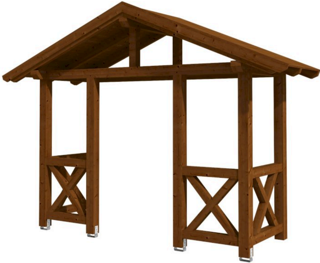
VORDACH STRALSUND 5 360 x 139 cm

Massive Konstruktion aus Konstruktionsvollholz (KVH-Fichte)