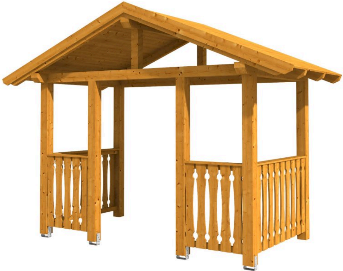
VORDACH STRALSUND 8 360 x 187 cm

Massive Konstruktion aus Konstruktionsvollholz (KVH-Fichte)