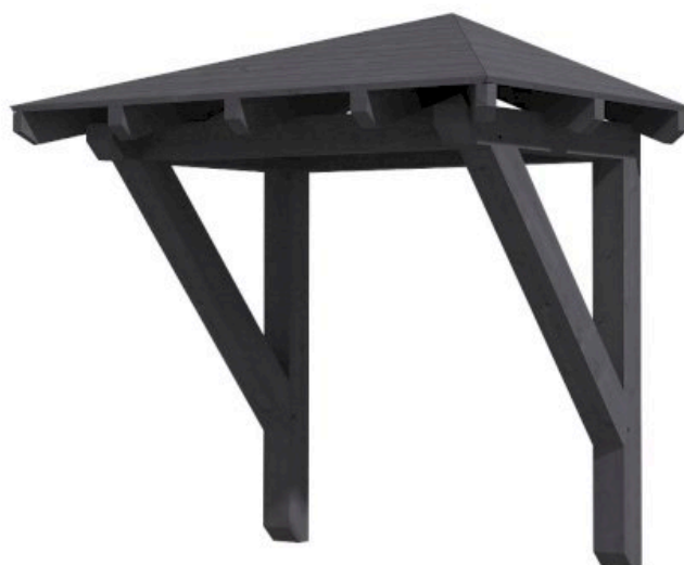
VORDACH WESEL 1 188 x 126 cm

Massive Konstruktion aus Konstruktionsvollholz (KVH-Fichte)