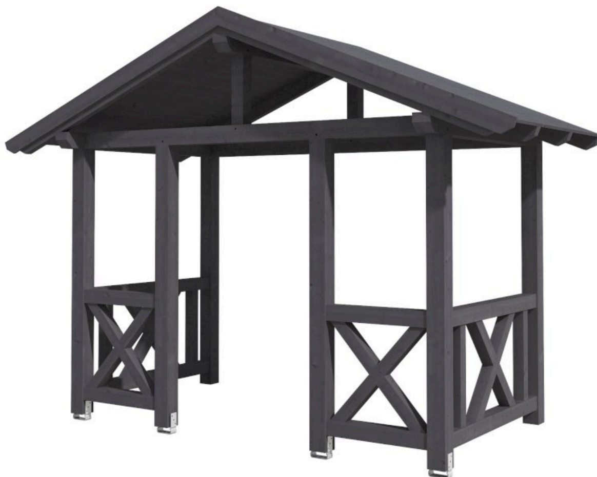
VORDACH STRALSUND 7 360 x 187 cm

Massive Konstruktion aus Konstruktionsvollholz (KVH-Fichte)