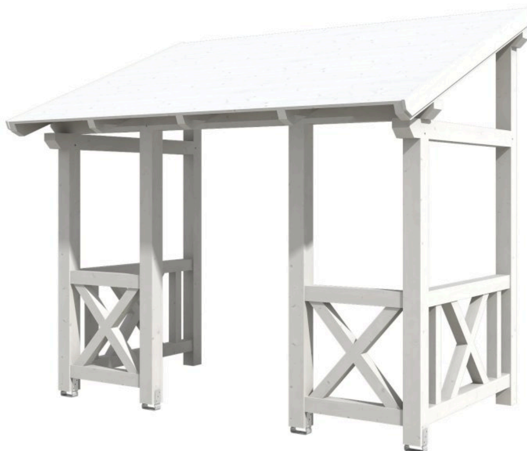
VORDACH PADERBORN 7 336 x 202 cm

Massive Konstruktion aus Konstruktionsvollholz (KVH-Fichte)