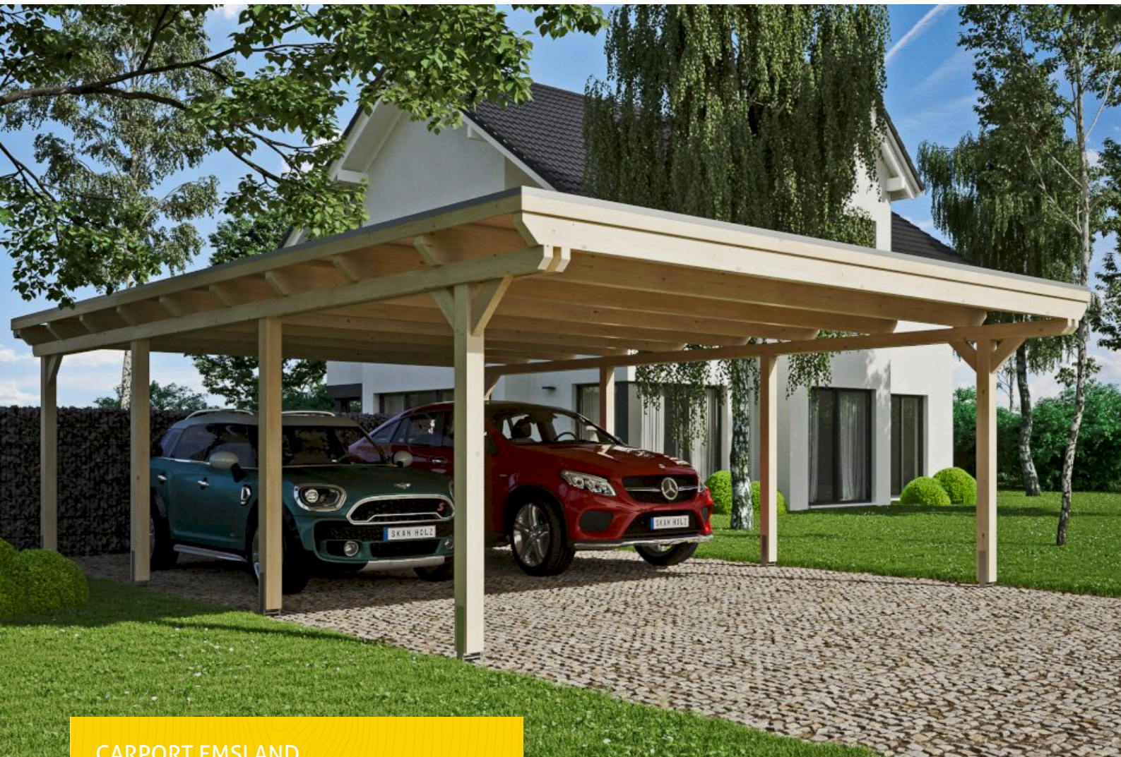
CARPORT EMSLAND 613 x 846 cm