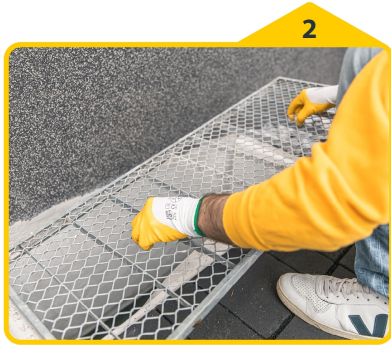
2 Lichtschachtabdeckung abnehmen.