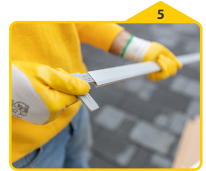
5 Die Eckverbinder in die Profile schieben und mithilfe eines Gummihammers einschlagen.