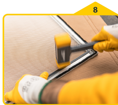
8 Gewebe mit Schlagkeder und Gummihammer fixieren.