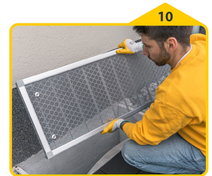
10 Gesamte Einheit wieder auf den Lichtschacht setzen.