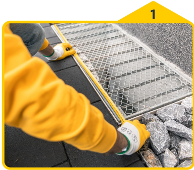
1 Länge und Breite des Lichtschachtes ausmessen.