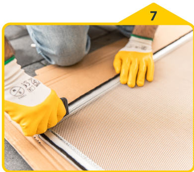
7 Gewebe zum Einkedern vorbereiten.