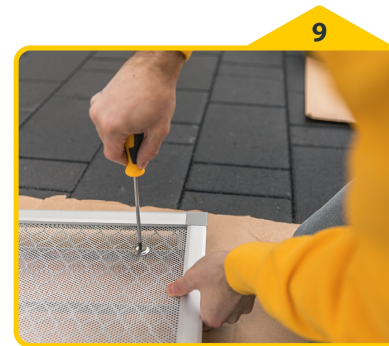
9 Lichtschachtrahmen mit Hilfe der beiliegenden Befestigungsschrauben auf der Abdeckung des Lichtschachtes fixieren..