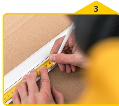
3 Kürzungsmaße auf die Rahmenprofile übertragen.