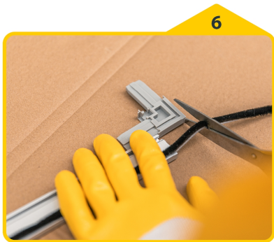
6 Bürstendichtungen einziehen.