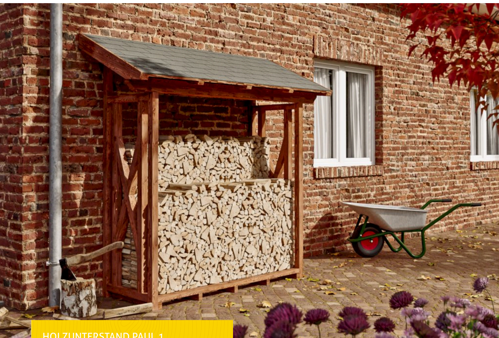
HOLZUNTERSTAND PAUL 1 240 x 88 cm