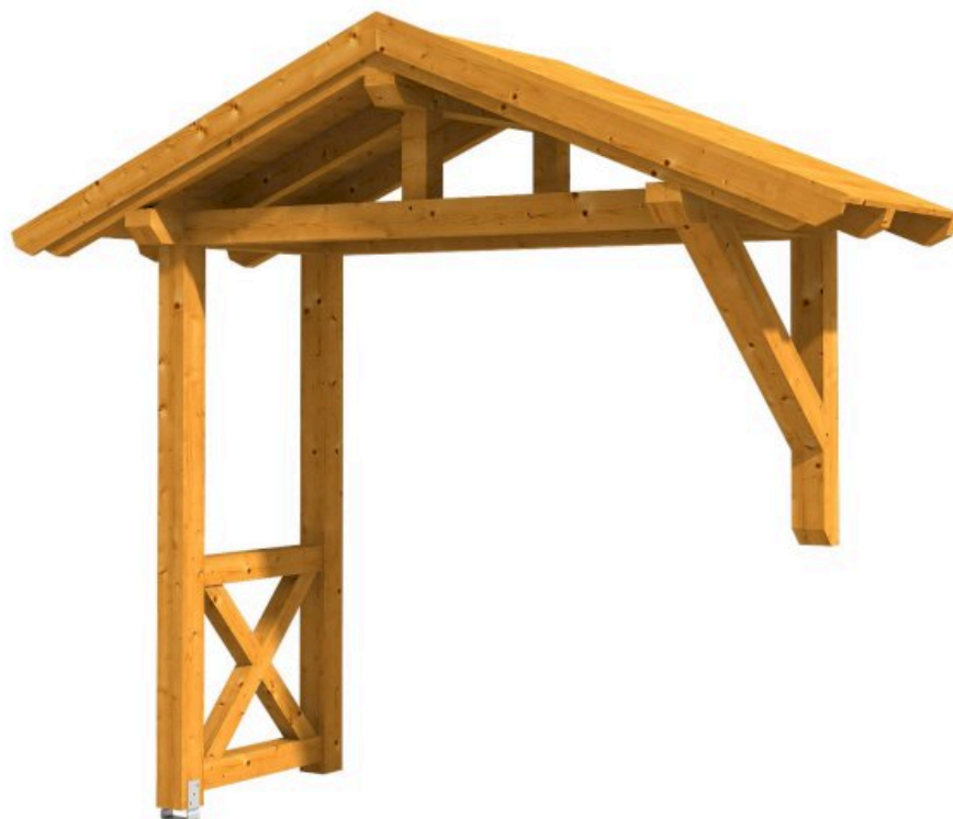
VORDACH STRALSUND 3 289 x 116 cm

Massive Konstruktion aus Konstruktionsvollholz (KVH-Fichte)